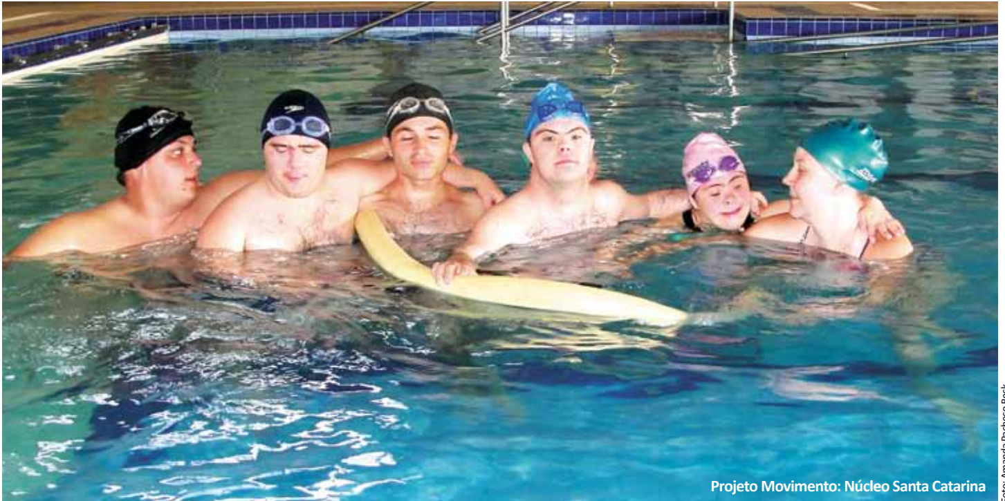
Projeto Movimento: Núcleo Santa Catarina